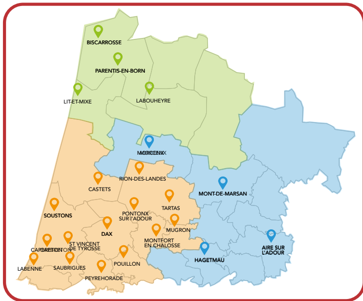
Cette carte est évolutive